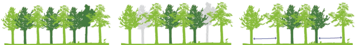
Les cloisonnements : ouverture de pistes parallèles dans une parcelle

Pour y parvenir, la première étape est l'ouverture d'un réseau de pistes dans les parcelles. En effet, les travaux forestiers nécessitent l'utilisation d'engins lourds comme des tracteurs ou des débardeurs, car un tronc pèse parfois plusieurs tonnes. Pour limiter l'impact de leur passage dans le sous-bois, des corridors sont tracés à intervalles réguliers par le forestier. Ces chemins de « cloisonnement » sont les seules zones où les engins pourront circuler pendant les chantiers à venir.