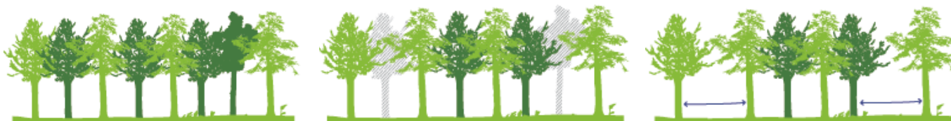
Les cloisonnements : ouverture de pistes parallèles dans une parcelle

Pour y parvenir, la première étape est l'ouverture d'un réseau de pistes dans les parcelles. En effet, les travaux forestiers nécessitent l'utilisation d'engins lourds comme des tracteurs ou des débardeurs, car un tronc pèse parfois plusieurs tonnes. Pour limiter l'impact de leur passage dans le sous-bois, des corridors sont tracés à intervalles réguliers par le forestier. Ces chemins de « cloisonnement » sont les seules zones où les engins pourront circuler pendant les chantiers à venir.